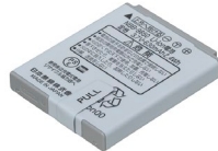
リチウムイオン電池パック(同梱品)： NBB-9650